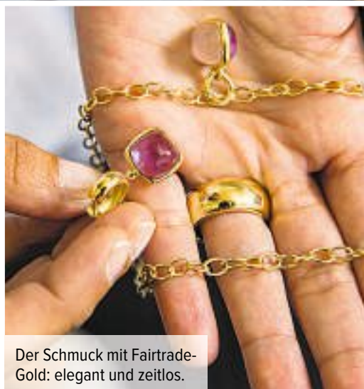
Der Schmuck mit Fairtrade-Gold: elegant und zeitlos.