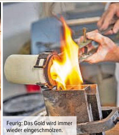
Feurig: Das Gold wird immer wieder eingeschmolzen.