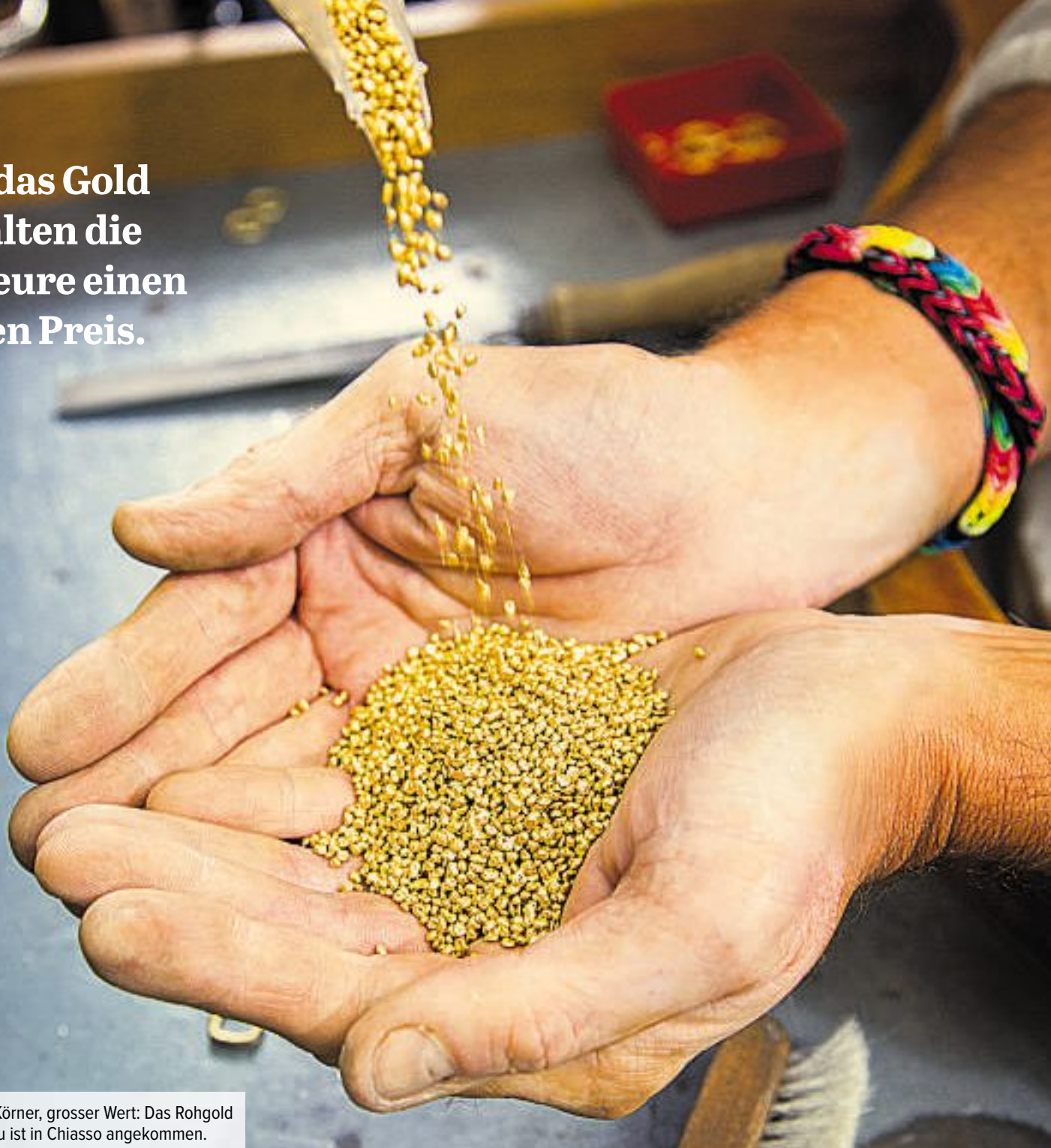
Kleine Körner, grosser Wert: Das Rohgold aus Peru ist in Chiasso angekommen.