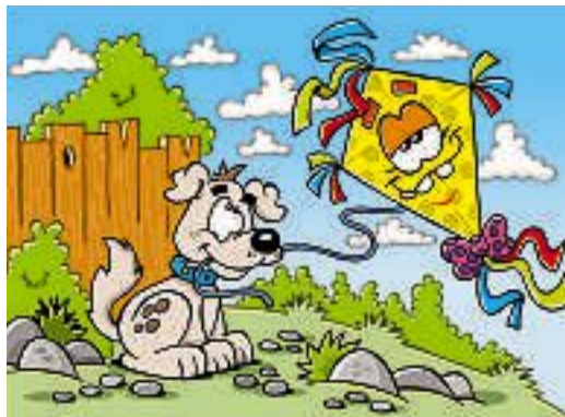
Illustrationen: Rätsel Agentur AG

Über die Rätsel und Wettbewerbe wird keine Korrespondenz geführt, der Rechtsweg ist ausgeschlossen.