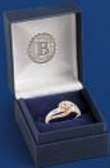
Das Schmuckstück erhalten Sie in einer edlen Geschenkok mit Echtheits-Zertifikat