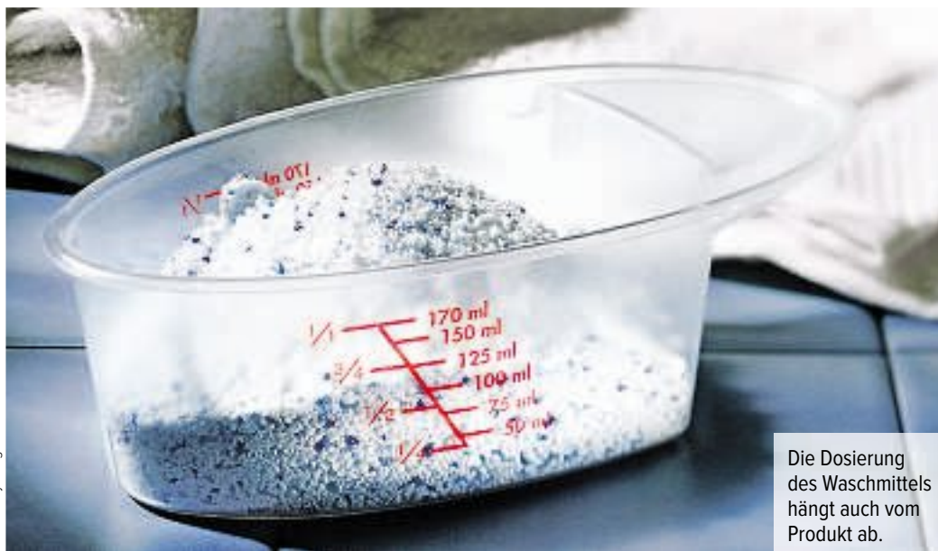
Die Dosierung des Waschmittels hängt auch vom Produkt ab.