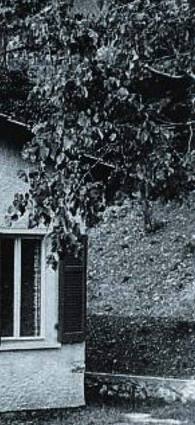
Reka-Ferien einst und jetzt: Früher waren es eher einfache Häuser wie hier in Albonago 1964. Heute heisst Reka auch Sport, Meer (Golfo del Sole) und Wellness.