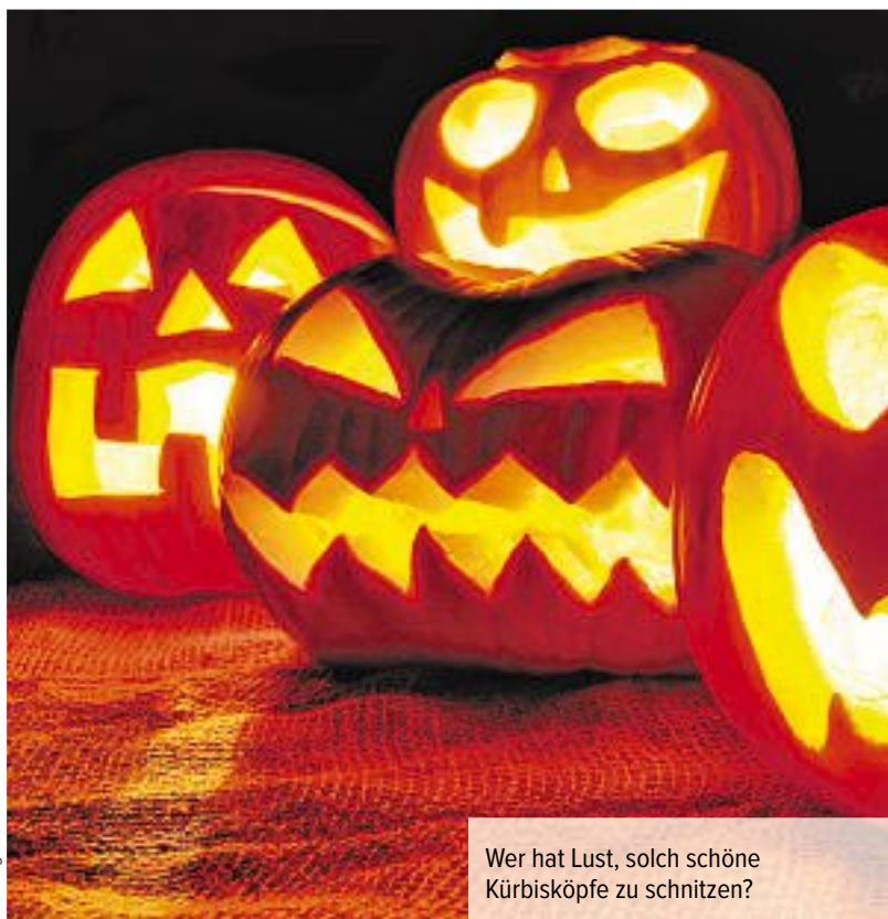
Wer hat Lust, solch schöne Kürbisköpfe zu schnitzen?

Auf die jüngere Kundschaft des Ziil-Centers wartet am Mittwoch von 14 bis 19 Uhr und am Freitag von 14 bis 20 Uhr ein besonderer Höhepunkt: Unter kundiger Anleitung können die kleinen Gäste einen mächtigen Kürbiskopf schnitzen. Die Teilnahme ist kostenlos und ohne Anmeldung möglich. • PD