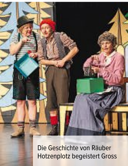
Die Geschichte von Räuber Hotzenplotz begeistert Gross

◆ Kindermusical «De Räuber Hotzenplotz» tourt zum zweiten Mal durch die Schweiz.