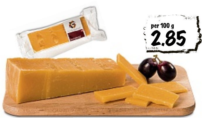
Slow Food Alpsbrinz gebrochen, ca. 200 g