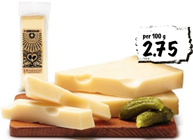
Slow Food Gotthelf-Emmentaler, ca. 250 g