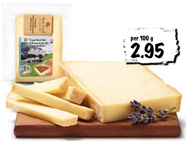
Slow Food Vacherin fribourgeois au lait cru, ca. 250 g