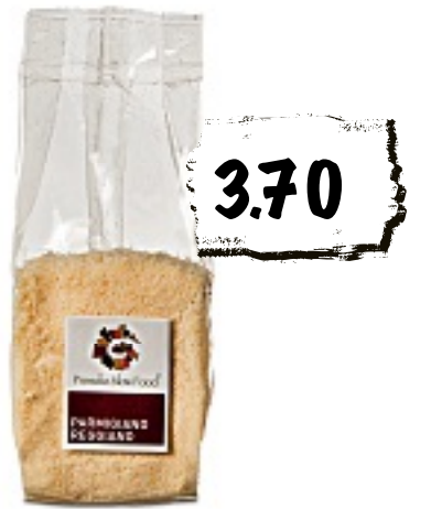
Slow Food Parmigiano Reggiano Vacca bianca gerieben, Packung à 80 g (100 g = 4.63)